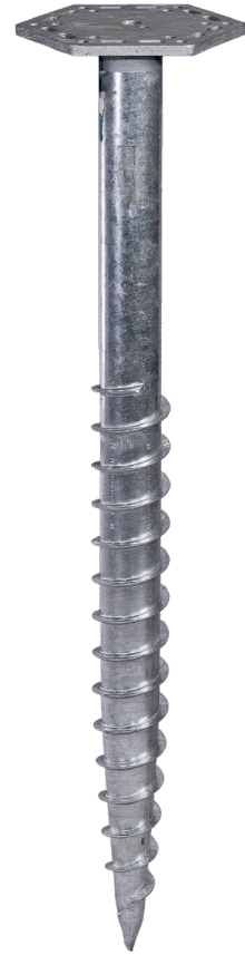
KSF M 76x1300-M24 (SW245/F12)

Adaptateur à visser : Z1 Rehausse F1234567 Art.-Nr. 21841