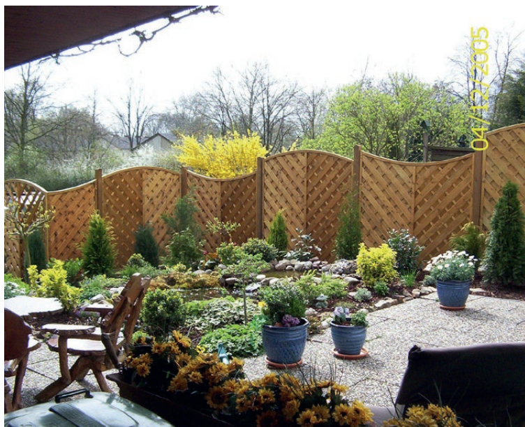
Pare-vue pour maison unifamiliale en pente