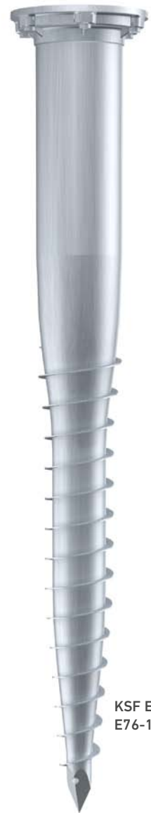
KSF E 140x1300- E76-100