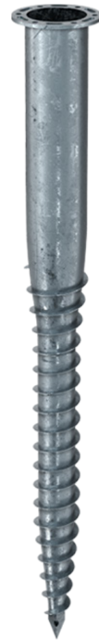
KSF F 140x1300-P

Technische Änderungen vorbehalten! Produkt für den beruflichen Gebrauch nach Instruktion.