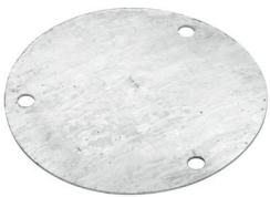
Abdeckung 2 mm-P Art.-Nr. 26818