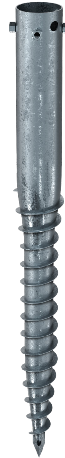
KSF G 114x1300-4xM16

Technische Änderungen vorbehalten! Produkt für den beruflichen Gebrauch nach Instruktion.