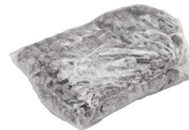
Spezialgranulat 1,50 kg Art.-Nr. 21824