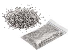
Spezialgranulat 0,50 kg Art.-Nr. 21823