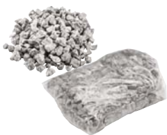
Spezialgranulat 1,50 kg Art.-Nr. 21824