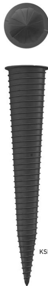
KSF K 60x800