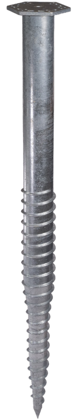
KSF M 140x2100-M24 (SW245-F15)

Technische Änderungen vorbehalten! Produkt für den beruflichen Gebrauch nach Instruktion.