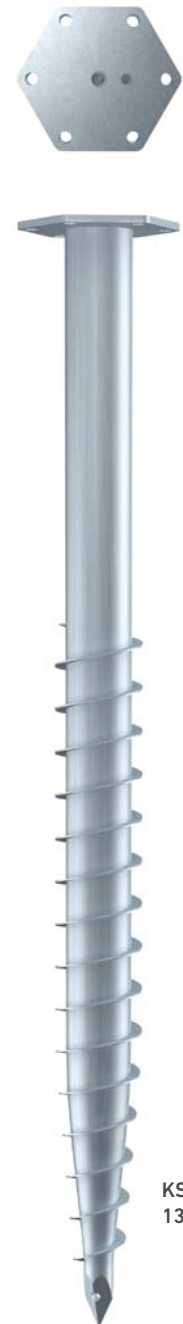
KSF M 76x 1300-M16