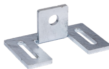
Kippflansch mit 2 x Langloch 0,3 kg Art.-Nr. 10130