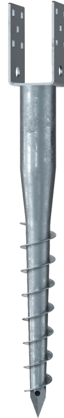
KSF U 60x730-71

Technische Änderungen vorbehalten! Produkt für den beruflichen Gebrauch nach Instruktion.