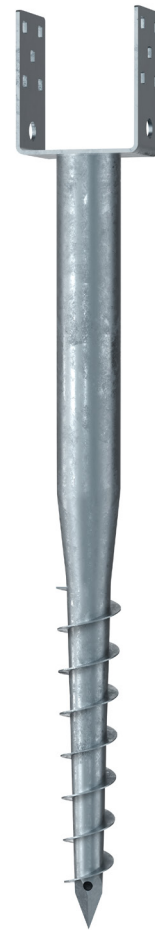
KSF U 60x730-111

Technische Änderungen vorbehalten! Produkt für den beruflichen Gebrauch nach Instruktion.