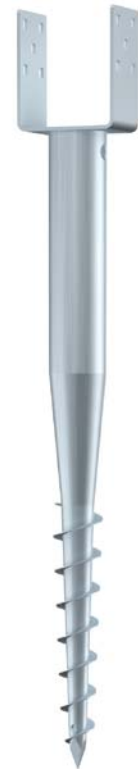
KSF U 66x 730-111

Eindrehstange kurz 0,60 kg Art.-Nr. 20070