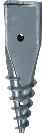
KSF X 135x480-LPS

Technische Änderungen vorbehalten! Produkt für den beruflichen Gebrauch nach Instruktion.