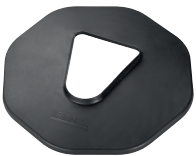
Abdeckungs-manschette-LP Art.-Nr. 22801