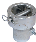
Adaptateur à visser : Z1 Rehausse A68 Art.-Nr. 21833