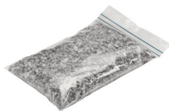
Granulés spéciaux 0,50 kg Art.-Nr. 21823