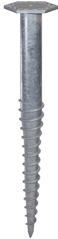
KSF M 76x1300-M24 (SW245/F15)

Adaptateur à visser : Z1 Rehausse F1234567 Art.-Nr. 21841