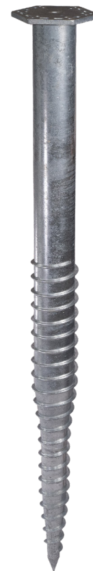
KSF M 140x2100-M24 (SW245-F15)